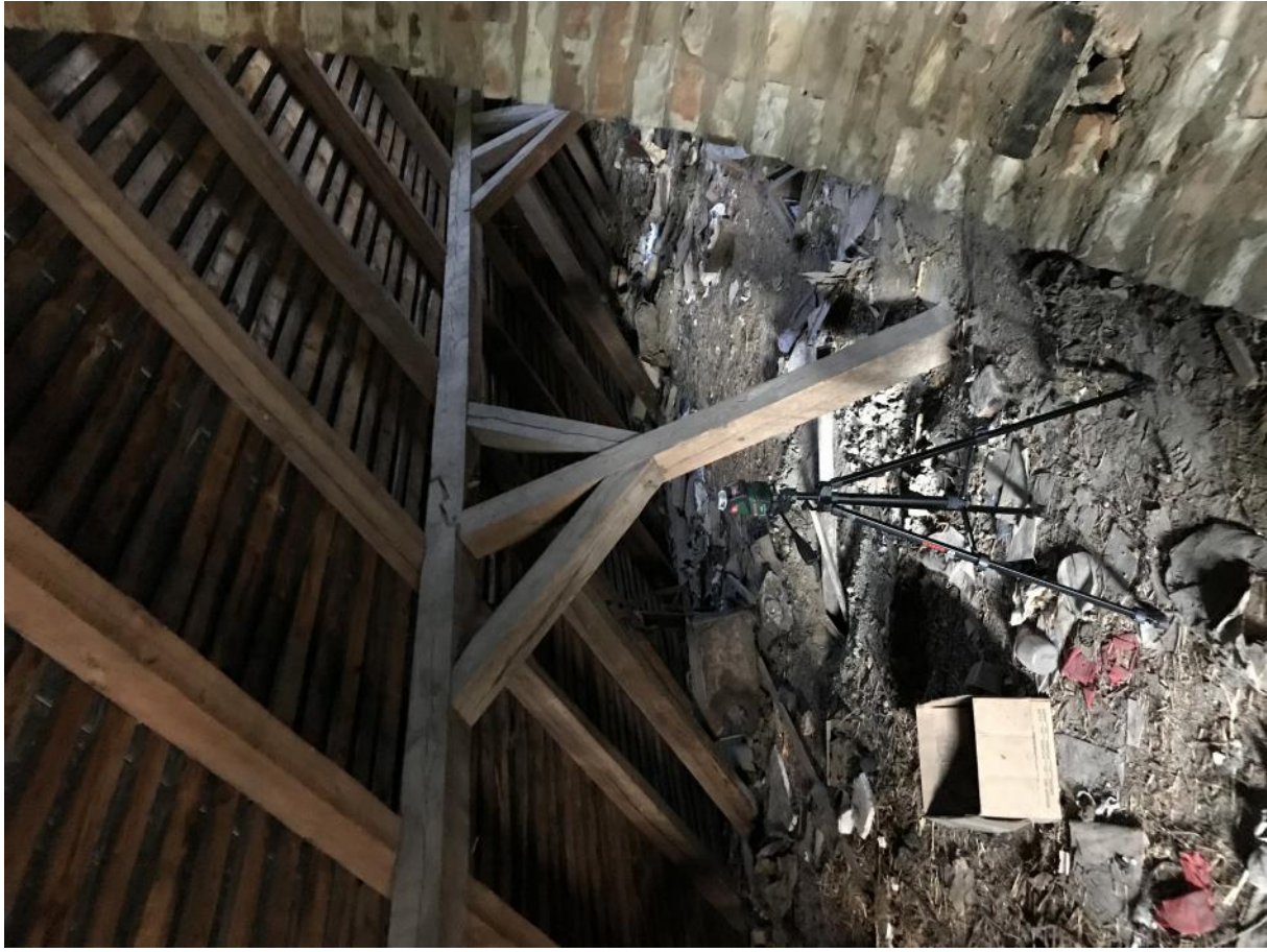
Fot. 35. Wieżba dachowa